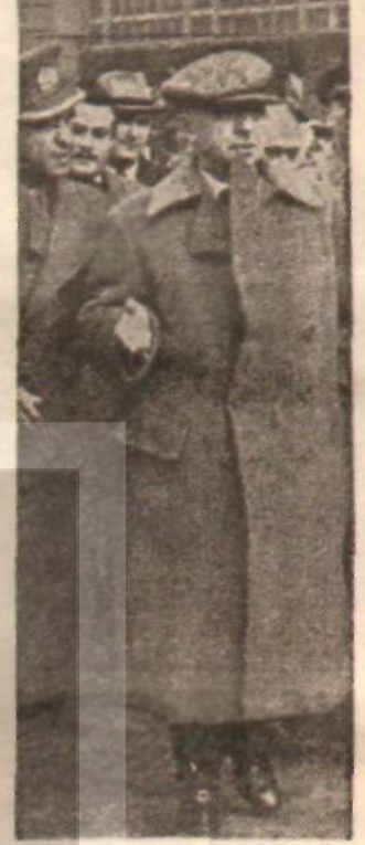
Millî Şef İnönü Bnyk devrimini günlerinde

Demez mi? Ay-yıldız, şarklıbın ve gerilgin dş belrtileri sayıyordu. Bu dş belrtileri altıoka çövrmelele Batıya daha kısa yoldan