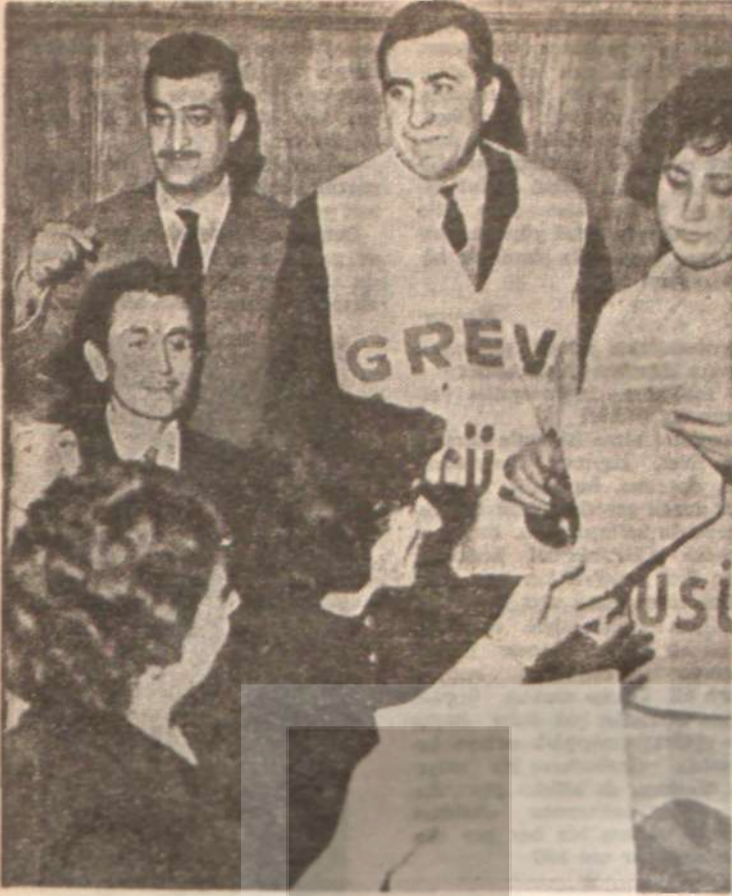
Bank-İş grevlerinden bir grup Bütün sendikalar destekliyor